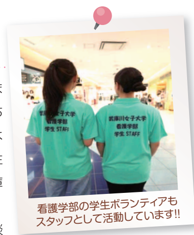
看護学部の学生ボランティアもスタッフとして活動しています!!