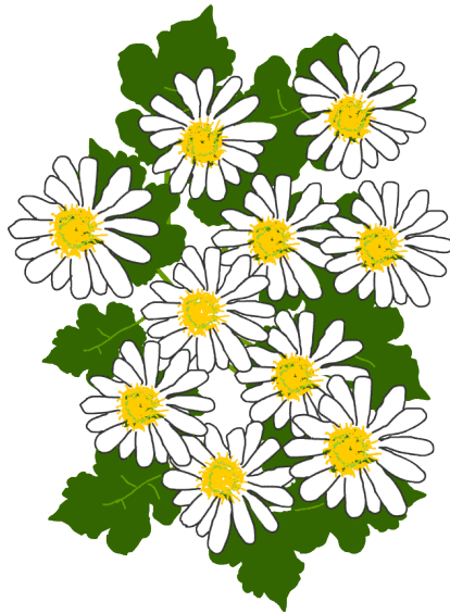
兵庫県花 のじぎく